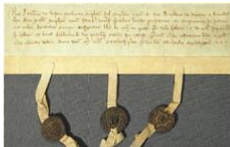
De akte uit 1345.