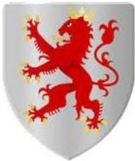
Het wapen van de graafschap Zutphen

In de graafschap Zutphen (tegenwoordig globaal het gebied dat we "De Achterhoek"