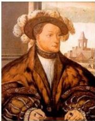
Karel van Gelre

Hertog Karel van Gelre was een sluw man. In 1504 moest hij vrede sluiten met de Habsburgers (in de persoon van Filips de Schone), en werd verbannen naar het Spaanse hof. Karel reisde naar Antwerpen om zich in te schepen naar Spanje, maar toen hij vernam dat Filips reeds naar Spanje was teruggekeerd, zag hij zijn kans schoon en vestigde zich in 1505 weer als hertog in Gelre. Het jaar daarop overleed Filips, en dat gaf Karel gelegenheid om zijn hertogdom Gelre beetje bij beetje terug te veroveren. In 1513 werd Karel door de Habsburgers als hertog erkend.