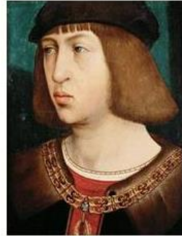
Filips de Schone

Tegen deze 'buitenlandse' overheersing bleef verzet bestaan en in 1493 herkreeg Gelre zijn zelfstandigheid onder hertog Karel van Gelre. Het conflict was daarmee niet uit de wereld. In 1502 ging de strijd tussen de Habsburgse koning van Castilië, dat is Filips de Schone en Karel, de hertog van Gelre. Filips de Schone was in 1504 in Brussel gekroond tot koning van Castilië en in 1506 vertrok hij naar Spanje om zijn rechten te doen gelden.